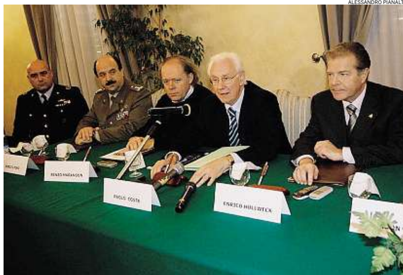
► Il tavolo della conferenza a Padova. Da destra Hullweck e il commissario governativo Costa

«Non faccio altro che constatare la realtà: siamo di fronte a un aeroporto con funzionalità limitata e scarsi profitti». Il commissario Paolo Costa, pur sostenendo di seguire con molta attenzione il problema dello scalo vicentino, mette le cose in chiaro a chi avanza recriminazioni chiedendo un risarcimento danni per l'eventuale paralisi dell'aeroporto. «Lo spostamento a ovest interferisce con i piani di sviluppo dello scalo? Se produrrà dei danni rilevanti lo Stato valuterà come porre rimedio - continua - Mi dicano quale piano concreto di rilancio stiamo mettendo in crisi, io non vedo alcuna dimensione finanziaria in questo momento. Ma non ho alcuna difficoltà a ovestermi sul tavolo per affrontare la questione». Tema delicato ma non insormontabile. «Lo spostamento della pista previsto dal progetto ha bisogno di essere gestito coerentemente con i tempi e i modi della base - aggiunge Costa - Fortunatamente, e non sono ironico, quella dell'aeroporto vicentino non è un'attività così intensa che impedisce di rendere incompatibile il proseguo dei lavori». La dimostrazione, secondo il commissario, sarebbe l'attività di bonifica bel-