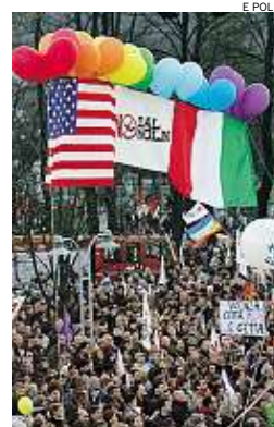
► Il corteo del 17 febbraio